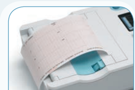
FÁCIL DE LEER

Ahorra tiempo valioso y asegura la captura de datos precisos al resaltar las señales y conexiones deficientes.