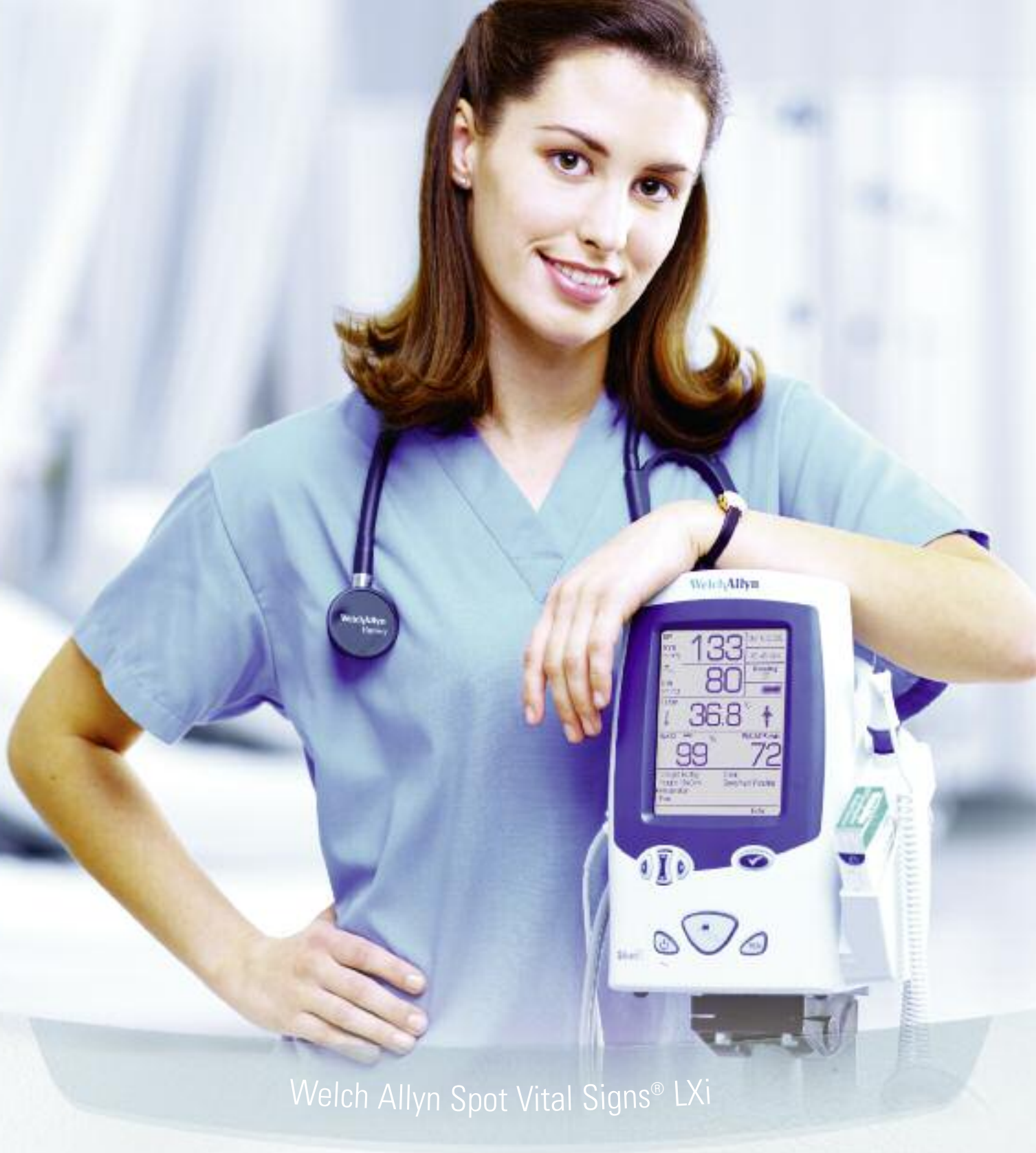
Welch Allyn Spot Vital Signs® LXi