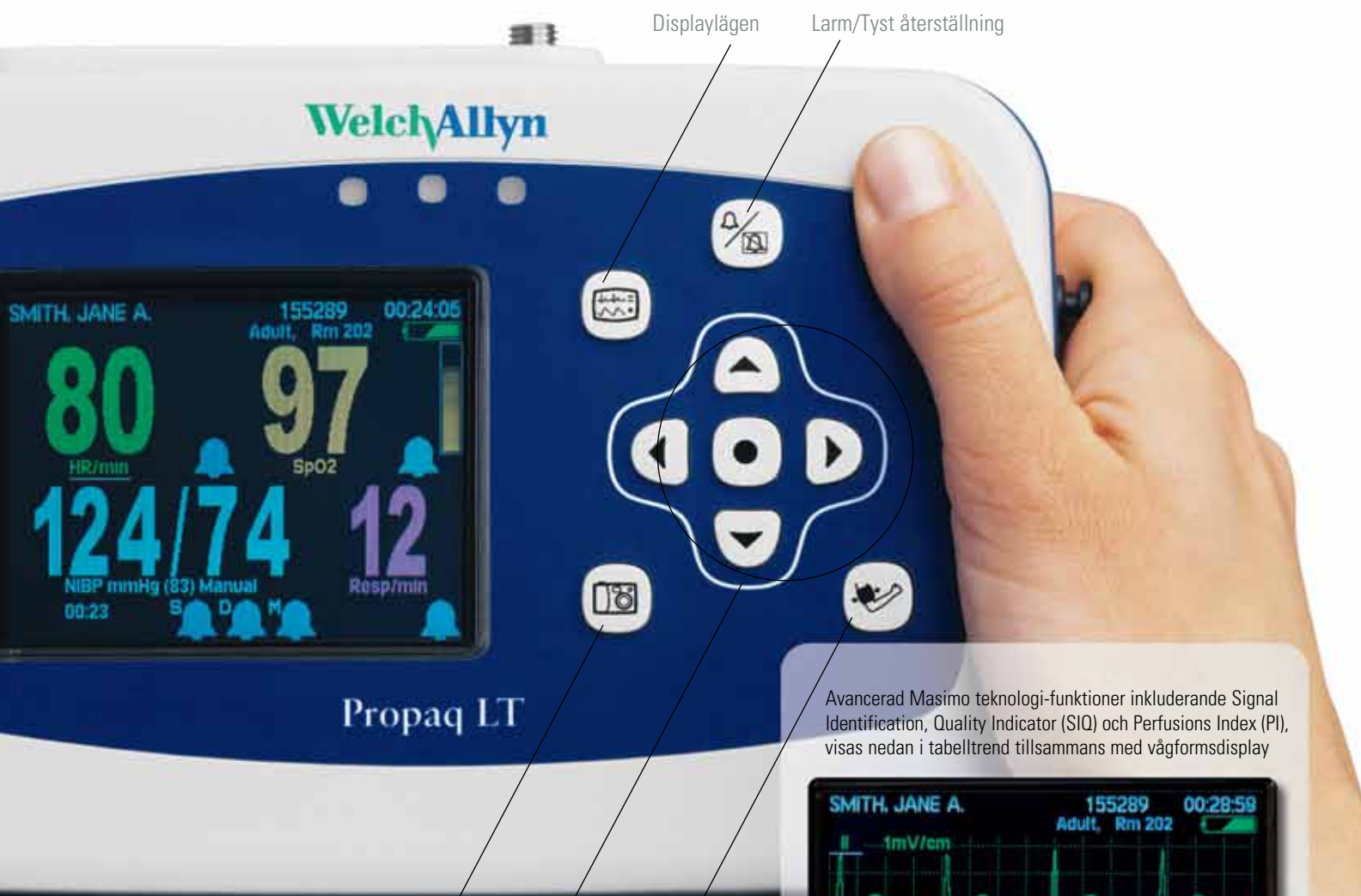
BILD I FAKTISK STORLEK: Welch Allyn Propaq LT väger mindre än ett kilo.

Avancerad Masimo teknologi-funktioner inkluderande Signal Identification, Quality Indicator (SIQ) och Perfusions Index (PI), visas nedan i tabelltrend tillsammans med vågformsdisplay