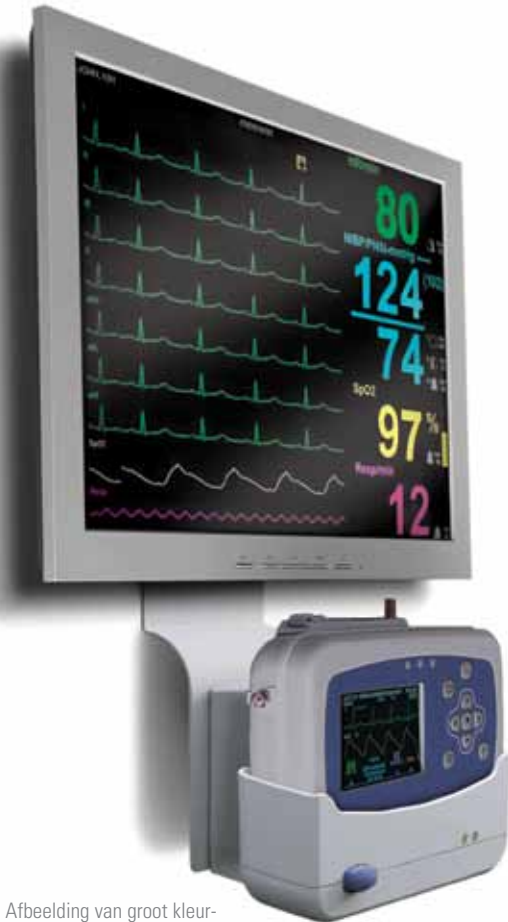
Afbeelding van groot kleurendisplay aan de muur.

Kies uit een weergavemodus van 4 of 9 wavevormen en lees eenvoudig cijfers van de vitale functies, wavevormen en alarmlimieten af.