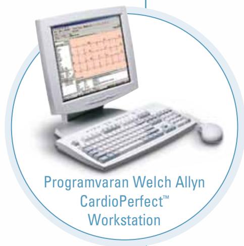
Programvaran Welch Allyn CardioPerfect™ Workstation

Kraftfull programvara som förenklar datahanteringen.