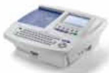
CP 100™/CP 200™ vilo-EKG