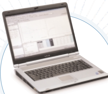
Software de la Estación de trabajo CardioPerfect™ de Welch Allyn