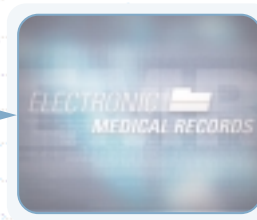
Conecta con los sistemas de las historias clínicas electrónicas

El Espirómetro SpiroPerfect™ conectado a PC de Welch Allyn descarga la información al software de la Estación de trabajo CardioPerfect™ de Welch Allyn, lo que proporciona eficiencia sin papeles al igual que la posibilidad de conectarse a muchos sistemas líderes de EMR. Este software pone al alcance de las manos las historias de los pacientes desde diversos instrumentos de diagnóstico de Welch Allyn, haciendo posible que pueda almacenar, acceder, revisar, comparar y editar los datos de las pruebas diagnósticas desde cualquier PC de la red.