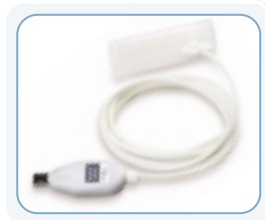
Espirómetro SpiroPerfect™ conectado a PC de Welch Allyn