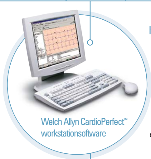
Welch Allyn CardioPerfect™ workstationsoftware