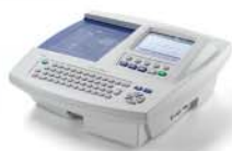
ECG a riposo