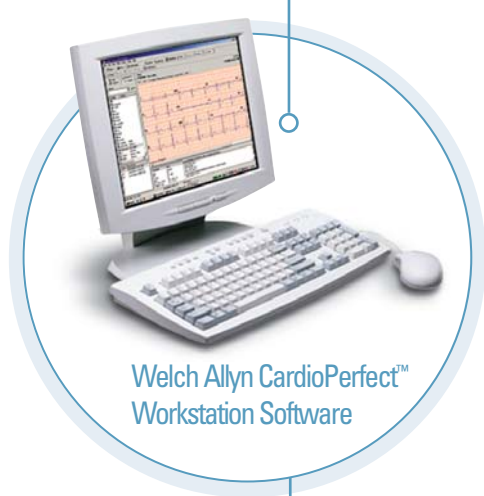
Welch Allyn CardioPerfect™ Workstation Software